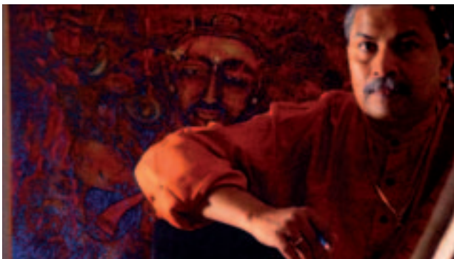
Der berühmte Maler Paresh Hazra, der in München ausstellen will