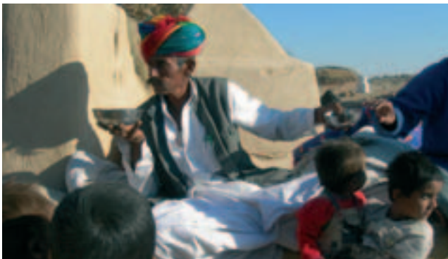
Wüstendorf bei Jaisalmer