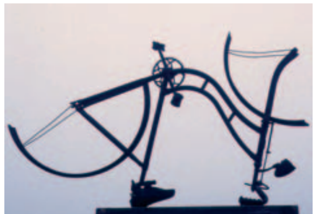
Radlosigkeit, Objekt 88 x 165 x 58 cm