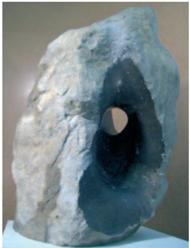
Le caractère, Jurakalk 52 x 25 x 23 cm