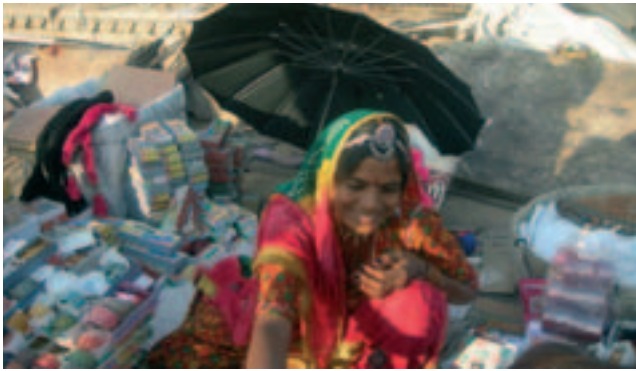
Straßenverkäuferin in Jodhpur