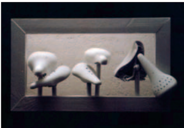
Vis-à-vis, Objekt 50 x 85 x 26 cm