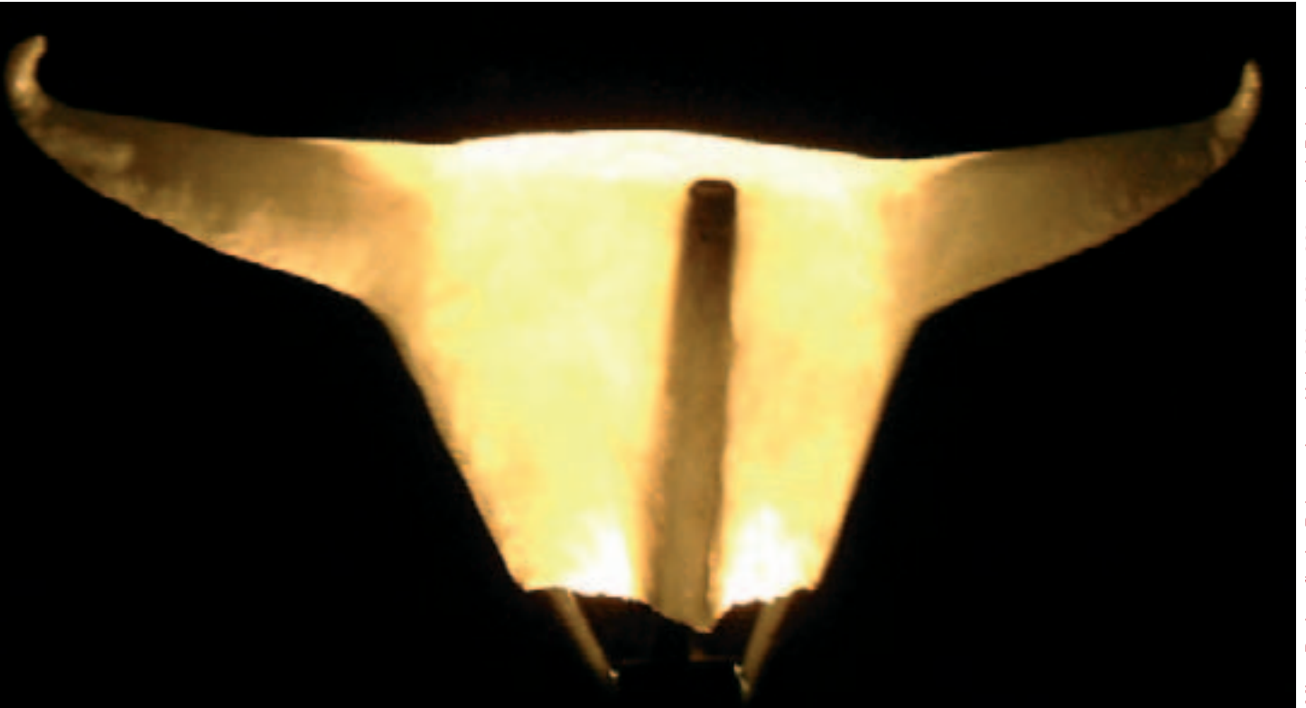
Mino, Drahtgeflecht, Polyesterharz, Holz 380 x 220 x 220 cm (mit Beinen)