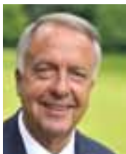
Bernd Neumann, MdB Staatsminister bei der Bundeskanzlerin Der Beauftragte der Bundesregierung für Kultur und Medien