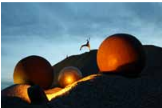
„Kugeln“ von Thurner und Lechner sowie „Raumgestalt 1“ von Ulrich Schweiger begeisterten neben vielen anderen Skulpturen mehr als 10.000 Besucher der Ausstellung „Kunst im Kies“ 2011.

Zwei bis drei Ausstellungen im Jahr organisiert das Kunstkreis-Team; als Ausstellungsräume werden das „Alte“ und/oder das „Neue Rathaus“ in Gräfelfing genutzt. Dieses Jahr wird zusätzlich vom 15. Juni – 31. Juli 2013 das gesamte Gemeindegebiet als Kunstparcour inszeniert; verschiedene Kunstgattungen über Malerei, Skulptur, Installation, Licht- und Fotokunst sollen im Innen- und Außenbereich gezeigt werden. Zusätzlicher Höhepunkt wird im Rahmen dieser Ausstellung die Verleihung des 3. Gräfelfinger Kunstpreises mit Preisgeldern bis zu 12.000 € sein. Die Auswahl der Künst-