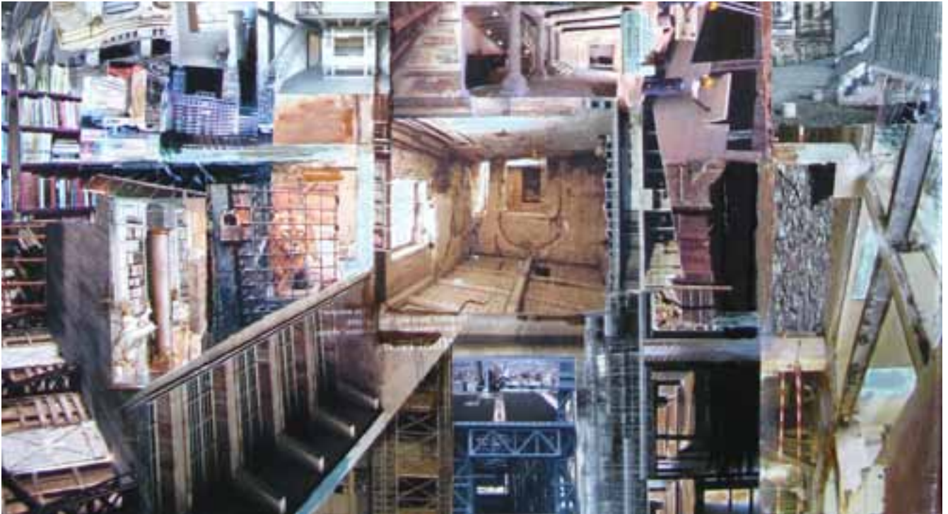
„Immobilie“, 2010, Collage/Acryl auf Leinwand, Ausschnitt

Ihr zu begegnen bedeutet, in einen Sturm zu geraten. Galina Troizky ist immer direkt, leidenschaftlich und unglaublich vital, manchmal fast abweisend, wenn sie ihre Überzeugungen durchsetzen will. Dahinter aber versteckt sich ein mitfühlendes, weiches Herz, das zart und verletzlich ist. Ein Stoff, aus dem wahre Künstler geboren werden.