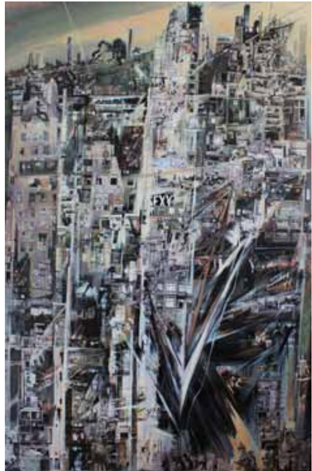
„Berlin“, 2012, Collage/Acryl auf Leinwand