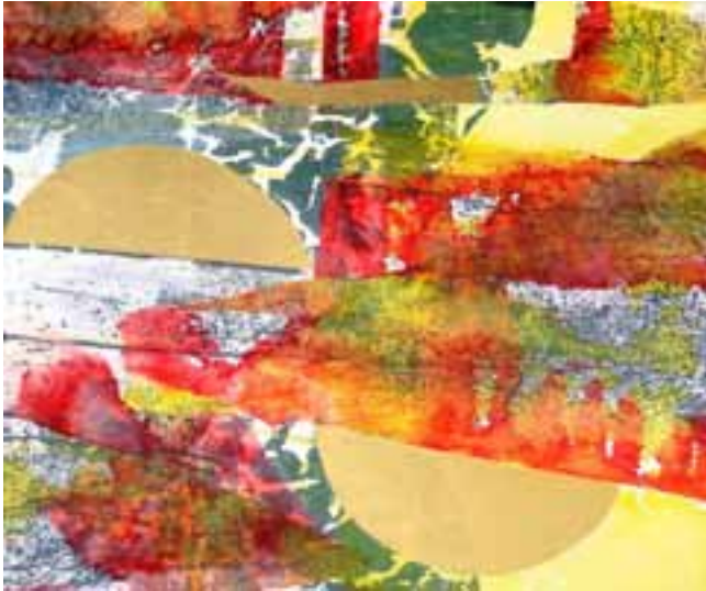
„Golden Globe“ – 50 x 60 cm, Malerei mit Papier auf Leinwand

Auf die Frage, welcher Künstler sie nachhaltig beeinflusst habe, nennt die Planeggerin den Nachkriegsabstrakten, mehrfachen Documenta-Teilnehmer und Gründer der Künstlergruppe Zen49, Fritz Winter. Auch er hatte das Bild als eigenständiges Gefüge betrachtet und nicht auf eine strenge Formensprache, sondern vielmehr auf Farbwerte und Komposition gesetzt.