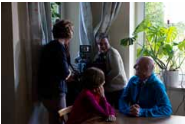
Probe für die Kamera

nell und charmant unprofessionell wirken, wenn das der Weg ist, die passende Crowd zu erreichen.