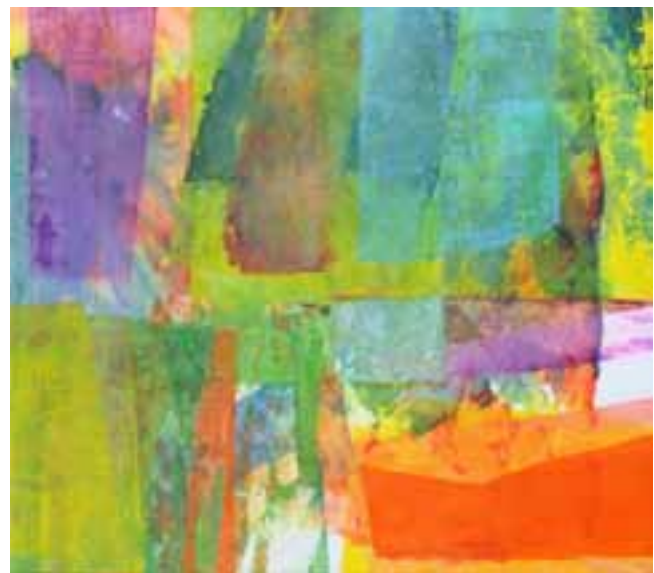
„Behind That Wall“ – 30 x 40 cm, Malerei mit Papier auf Leinwand

Die gebürtige Neustrelitzerin zählt zu der Nachkriegsgeneration, die mit Armut aufgewachsen ist und viele Entbehrungen erlitten hat. Sie empfand diese Situation keineswegs als Einschränkung, sondern entwickelte daraus eine große Kreativität zur Bewältigung des Mangels, die ihr ganzes weiteres Leben prägte. Die Eltern ließen sie eine Ausbildung zur Fremdsprachenkorrespondentin machen, in deren Augen eine sichere Zukunft. Für das junge Mädchen war es eine Chance, Sprachen zu lernen und zu reisen. Doch der Wissensdurst drängte Henny Schlüter zur Weiterbildung, sie machte berufsbegleitend ihr Abitur und dann war der Weg frei für das, was sie schon immer begeisterte, wovon sie schon lange träumte: Architektur zu studieren.