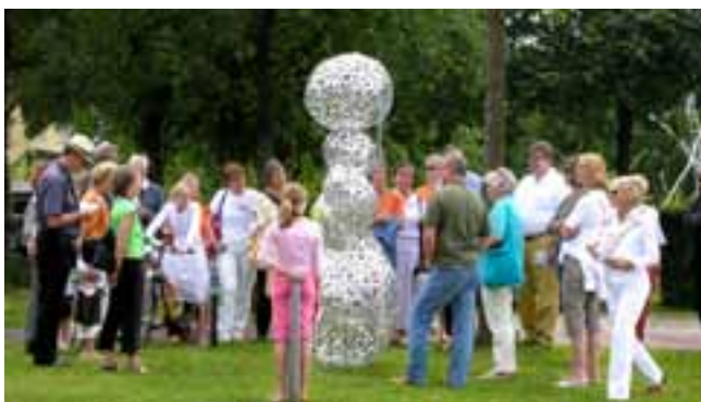
Besucher der Kunstmeile 2007 bewundern die Skulptur „Von Herzen“ der Künstlerin Erika Berckhemer.

Zwei bis drei Ausstellungen im Jahr organisiert das Kunstkreis-Team; als Ausstellungsräume werden das „Alte“ und/oder das „Neue Rathaus“ in Gräfelfing genutzt. Dieses Jahr wird zusätzlich vom 15. Juni – 31. Juli 2013 das gesamte Gemeindegebiet als Kunstparcour inszeniert; verschiedene Kunstgattungen über Malerei, Skulptur, Installation, Licht- und Fotokunst sollen im Innen- und Außenbereich gezeigt werden. Zusätzlicher Höhepunkt wird im Rahmen dieser Ausstellung die Verleihung des 3. Gräfelfinger Kunstpreises mit Preisgeldern bis zu 12.000 € sein. Die Auswahl der Künst-