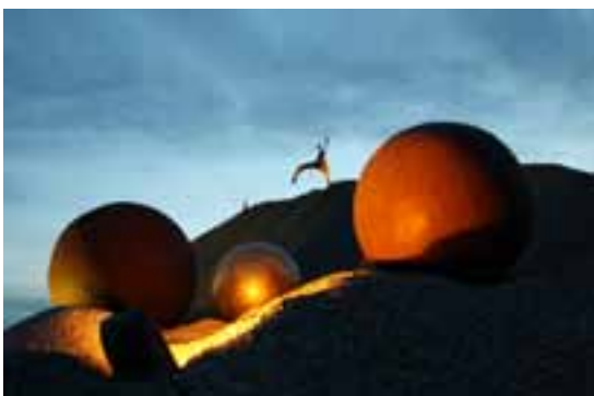
„Kugeln“ von Thurner und Lechner sowie „Raumgestalt 1“ von Ulrich Schweiger begeisterten neben vielen anderen Skulpturen mehr als 10.000 Besucher der Ausstellung „Kunst im Kies“ 2011.

2008 stellte der bekannte, amerikanische Pop-Art-Künstler James Rizzi im Neuen Gräfelfinger Rathaus aus