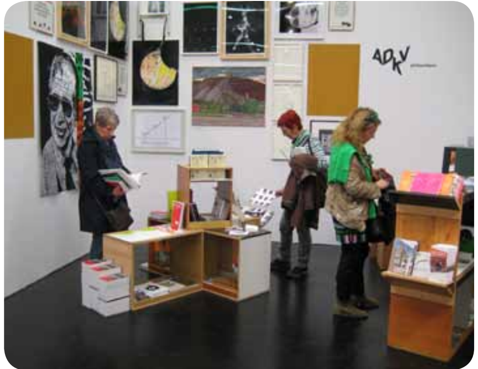
Messestand der ADKV auf der „ART COLOGNE 2014“, Foto: ADKV

Die Kunstvereine können auf eine rund 200-jährige Geschichte zurückblicken. Sie wurden im Zeitraum zwischen ca. 1800 und 1840 vom aufstrebenden Bürgertum und von Künstlern selbst gegründet. Ihr Ziel war die Vermittlung zwischen Laien und der Gegenwartskunst und nicht zuletzt der Verkauf aktueller Kunstwerke. Die Beschäftigung mit Kultur und das Sammeln von Kunst sollte nicht länger dem Adel überlassen bleiben. Vereine, so auch die Kunstvereine, waren Ausdruck